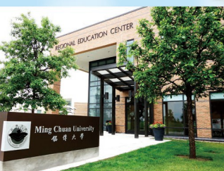
美國分校 Michigan Location, U.S.A.