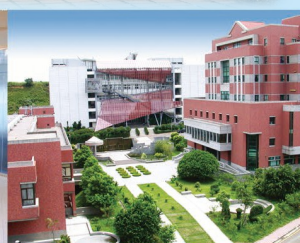
桃園校區 Taoyuan Campus