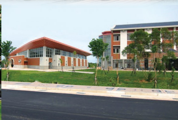
金門分部 Kinmen Location