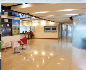
基河校區 Jihe Complex