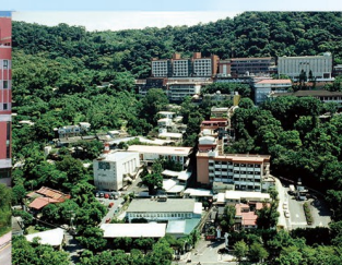
台北校區 Taipei Campus